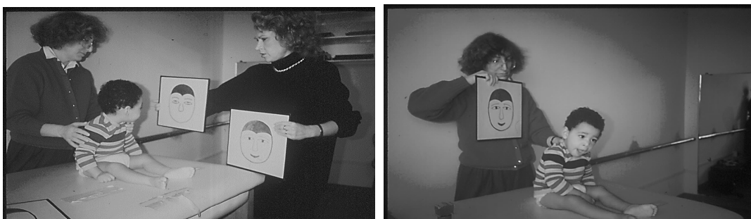
Figure 3 - Examination of «ocular exploration behaviour»

The observation of the child's ability to anticipate the vision of certain figures presented in sequence, it offers the possibility to verify also the acquisition, by the child, of rules that allow more adaptable behaviour. In fact, if the perceptual picture is presented to the child in a situation where some aspects may change (for example the «stimulus» appears once to the right and twice to the left of its visual field), it can be verified the ability to extrapolate from the situation certain rules and to elaborate sequences on the basis of these. In the presence of this ability, the child manages to direct the eyes in the right direction, even before the stimulus appears.