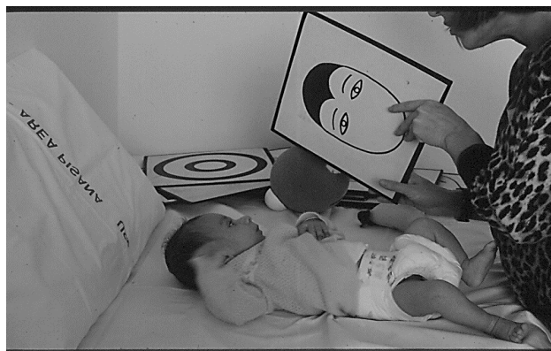
Figure1 - The sensitivity of the newborn to moving stimuli, to changes in light intensity and stimuli with contrast

The events that manage to activate the child's visual attention have different attributes. The newborn is sensitive to moving stimuli, to variations in light intensity and stimuli with contrast (fig.1)