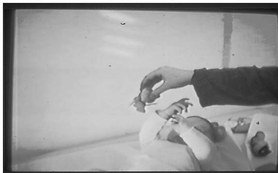
Figure 4- The action of the hand towards objects

The object is placed near the child's hand and the ability of the hand to relate to it is evaluated, in order to obtain the tactile information. Towards the three months the fingers of the hand are maintained in semiflexion and the extension of the fingers occurs only after contact with the surface of the object (fig. 4).